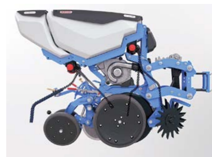
Aplikácia mikrogranulátu môže byť až do štyroch miest, v dávke 2 až 35 kg. Sejačka si viete nakonfigurovať aj s 25 a 15 l zásobníkom a 55 l pre osivo.

ASG systém je vhodný pre väčšie druhy semien. Aby však bolo možné vysievať napríklad aj repku, Monosem vybavuje sejačky tzv. Smart Acces. Ide o uľahčený prístup k dávkovaciemu ústrojenstvu a predovšet-