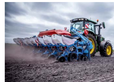
Zásobné hnojenie na základe aplikačných máp je v dávke až 600 kg na hektár.