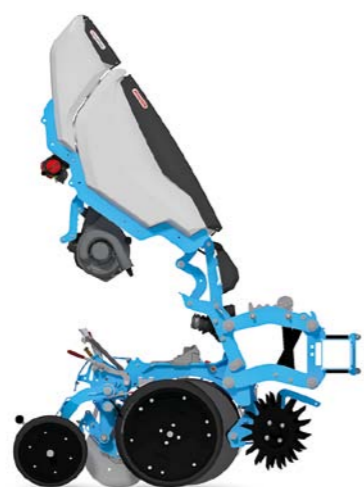
Zjednodušený servisný prístup Smart Acces skráti čas údržby alebo výmeny výsevných valčekov.