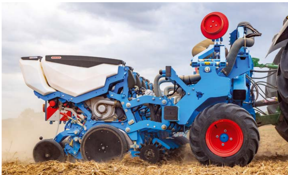
Vzdialeným prístupom k presnej sejačke, podobne ako v prípade najmodernejších traktorov, otvára Monosem nové možnosti.