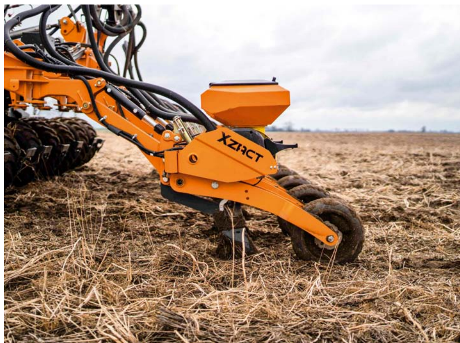
Výsevnú jednotku pre bežné plodiny viete vymeniť za XZACT pre presný výsev.