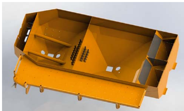
Zásobník môže mať až štyri komory.