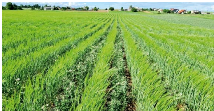
Nominovaný stroj dokáže vysiataj napríklad jačmeň súčasne s hrachom (hnojivo z prvej komory, jačmeň z druhej a hrach z oboch prídavných komôr).